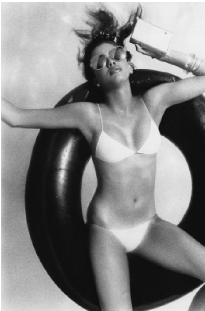
ALBERT WATSON Vogue , Mai 1977