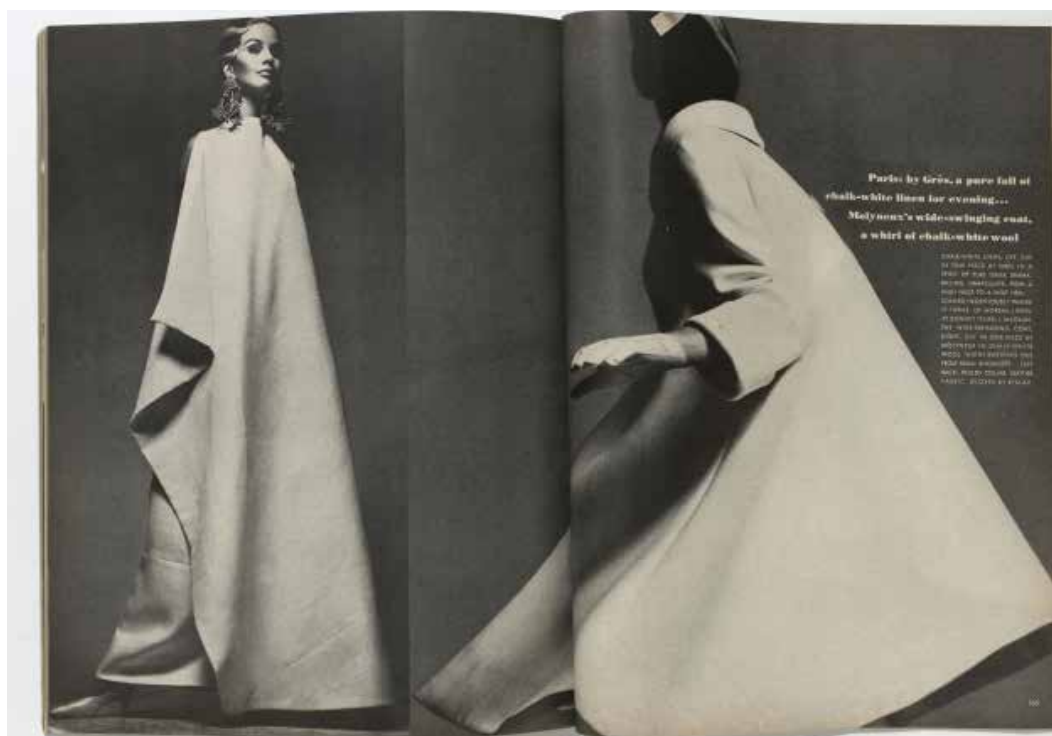
Vogue, März 1966

In der zweiten Hälfte des 20. Jahrhunderts war New York nicht mehr länger die exklusive Weltbühne der Mode – immer stärker standen London und Paris im Vordergrund. Die britische Ausgabe der Vogue trat aus dem Schatten des Mutterunternehmens heraus, und Edmonde Charles-Roux, seit 1954 Chefredakteurin der französischen Vogue , eröffnete einer ganz neuen Generation von Modelfotografen Möglichkeiten. Europa boomte. Guy Bourdin und Helmut