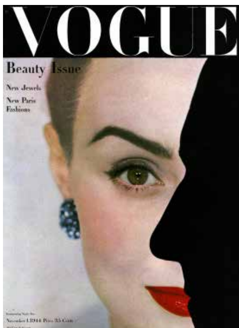
IRVING PENN Vogue , Oktober 1943