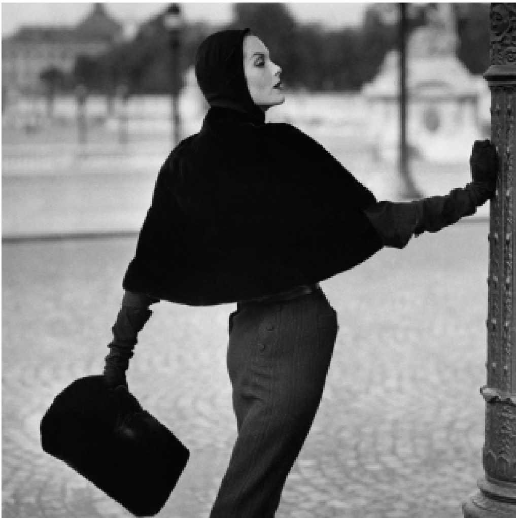
HENRY CLARKE Vogue , September 1955