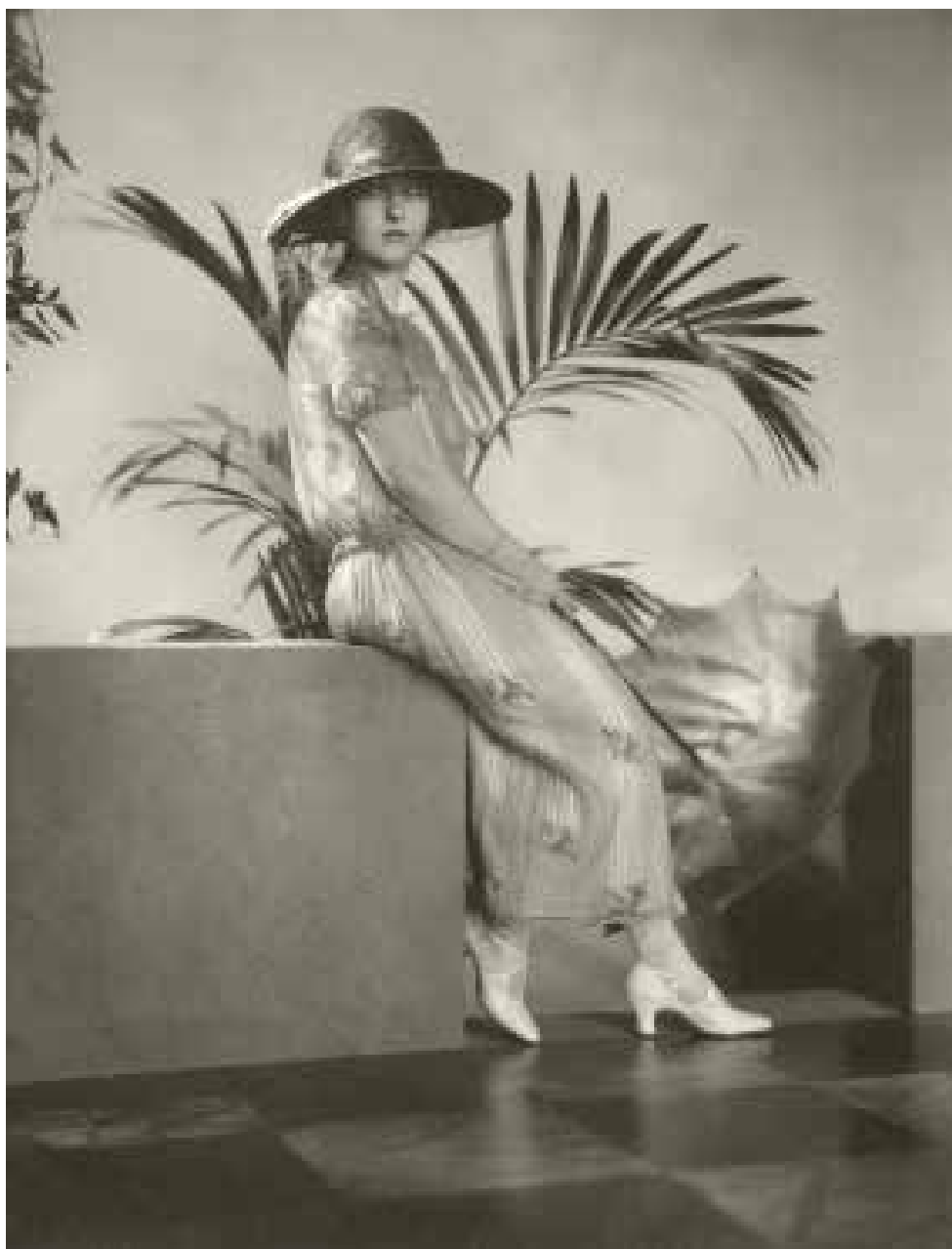
EDWARD STEICHEN Vogue , Januar 1924